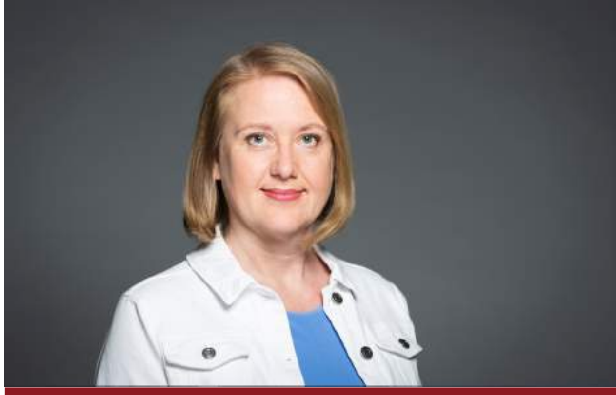
Lisa Paus, Bundesministerin für Familie, Senioren, Frauen und Jugend, MdB, Schirmherrin für das audit berufundfamilie / audit familiengerechte hochschule

Bundesministerium für Familie, Senioren, Frauen und Jugend